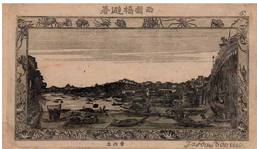
Gezicht op de Ryogoku brug, Edo (Ryōgokubashi no hisho) No 6 uit de serie Waarachtige gezichten in de Oostelijke Hoofdstad in koperplaten (Toto shōkei doban shinzu) Yasuda Sadakichi, alias Willem van Leiden (werkzaam 1820-59) Ca. 1821. Ets, 112 x 190 mm RIJKSMUSEUM VOOR VOLKENKUNDE, LEIDEN