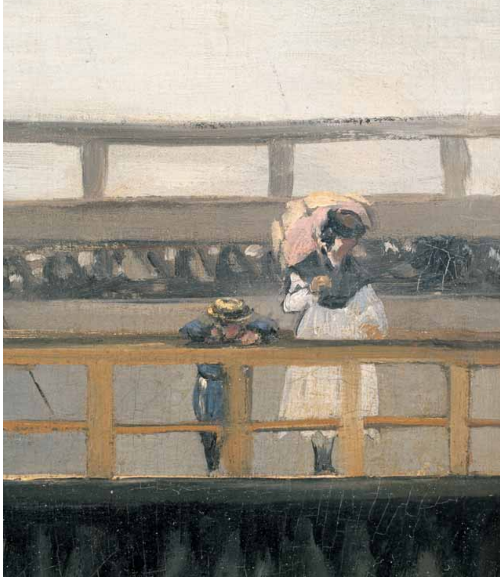
Boven, de pier van Boulogne-sur-Mer (detail).

Manet bracht in de voorste pier verder een speels effect aan, bestaande uit de ritmische herhaling van gekruiste palen. Dit was gebaseerd op zijn tekeningen van het motief, waarin de wandelpier van opzij is afgebeeld en die