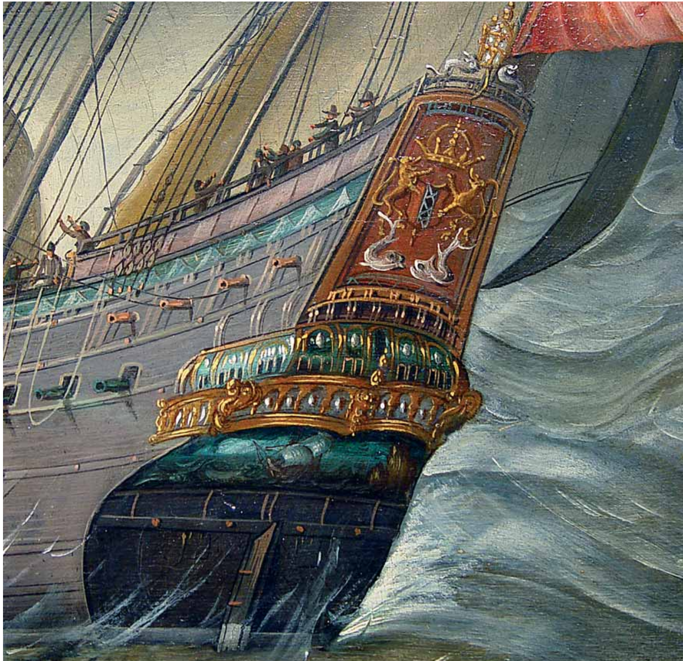
Detail: het achterschip van de Amsterdam .