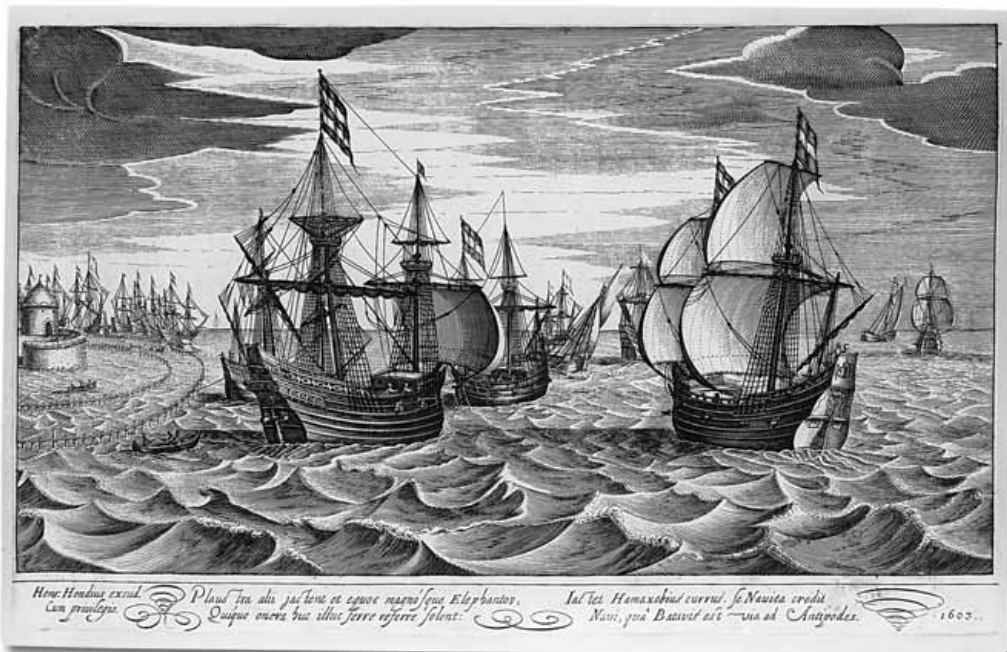
Schepen op een rede Gravure van Robert de Baudous, 1603

die tijd, evenmin als exacte afbeeldingen zoals vader en zoon Willem van de Velde die later in de 17de eeuw maakten. We moeten dus afgaan op bewijzen die hooguit aanemelijk maken dat het om een bepaald vaartuig gaat, zoals het aantal stukken geschut of de tuigage. De spiegelversieringen op dit schilderij hebben een dusdanig algemeen karakter dat niet ondubbelzinnig vaststaat dat inderdaad een specifiek schip wordt bedoeld. Wapens als dat van Amsterdam of Holland zouden evenzeer een verwijzing kunnen zijn naar die stad of provincie als naar de scheepsnaam en Neptunus kan ook een meer algemene verwijzing zijn naar de heerschappij over de zeeën.