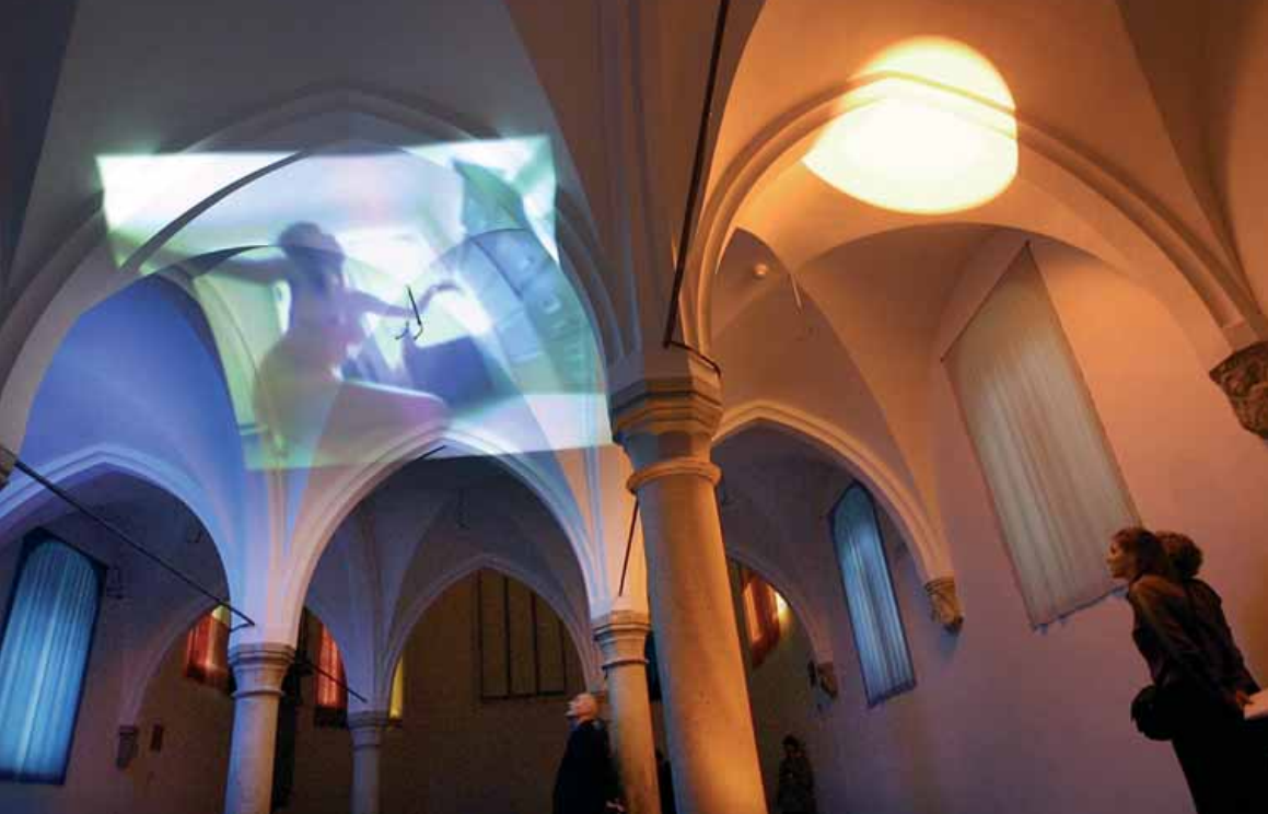
De installatie is zomer 2003 opnieuw te zien in de kapel van het Centraal Museum.