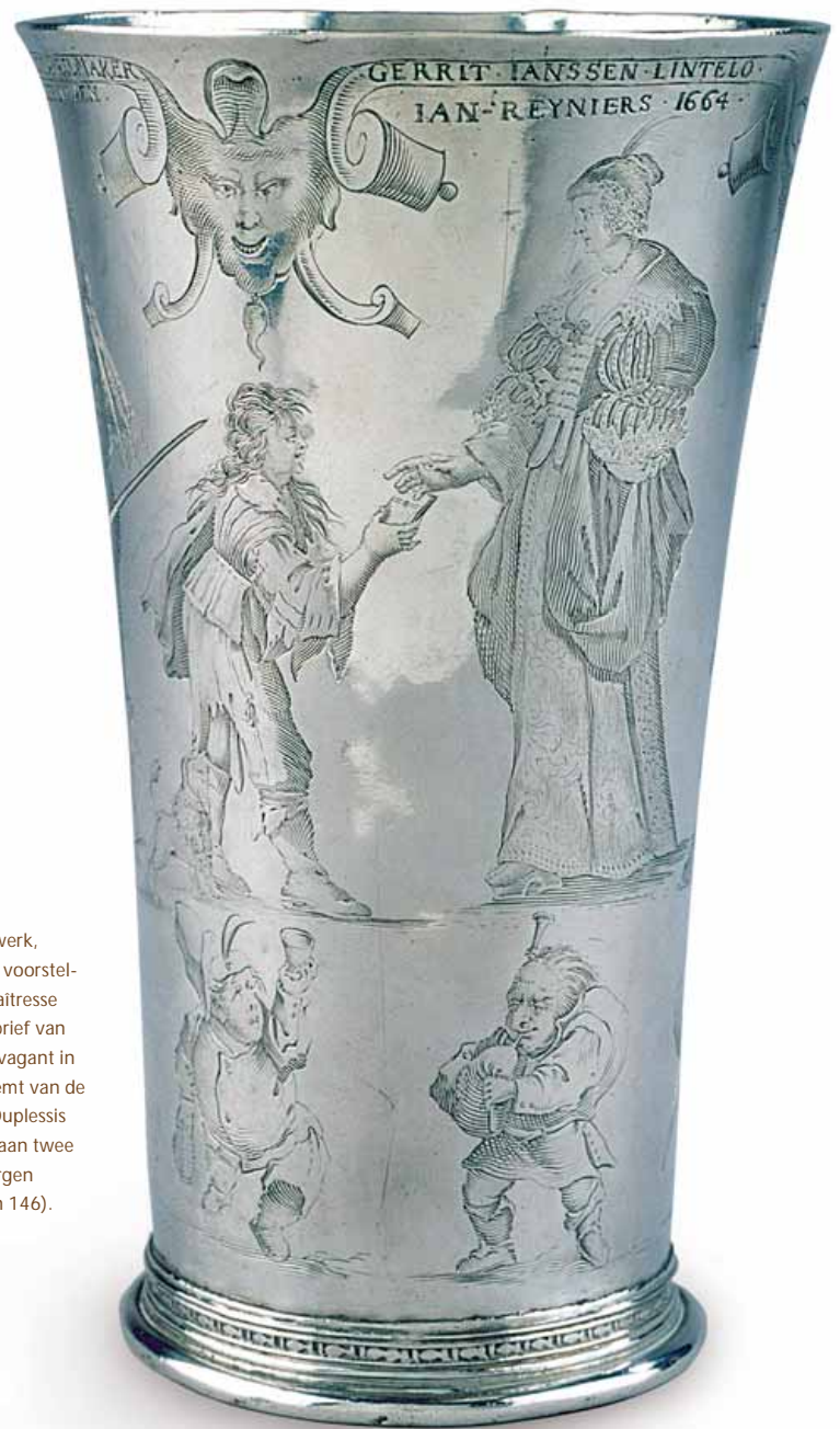
Masker in rolwerk, waaronder de voorstelling van de maitresse die de liefdesbrief van kapitein Extravagant in ontvangst neemt van de jonge bode (Duplessis 1403). Onderaan twee groteske dwergen (Lieure 133 en 146).

ANTONI MAGNUS EN HET DEVENTER GOUDSMEDENGILDE Antoni Magnus werd op 29 december 1605 in Deventer gedoopt als zoon van de militair Pouwel Magnus en Agnete Sweelinck, een dochter van de goudsmid Gerrit Sweelinck en familie van de beroemde componist Jan Pietersz. Sweelinck (1561-1621). Antoni vestigde zich in het huis van zijn vader in de Golstraat ('Goltstraet'). Als Anthonius Magnus goltsmit werd hem op 8 januari 1635 uyt sonderlinge gunst het grootburgerschap van de stad Deventer verleend. Toen op 10 februari 1677 zijn vrouw in de Lebuinuskerk werd begraven, was Magnus blijkens een aantekening in het begraafboek van de kerk nog in leven. Zelf moet hij dus op een later tijdstip zijn overleden, maar de exacte datum is niet bekend.