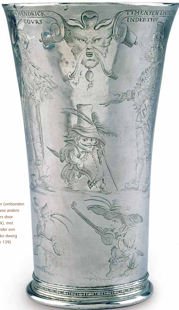
Masker (verbonden met twee andere maskers door rolwerk), met daaronder een groteske dwerg (Lieure 139).