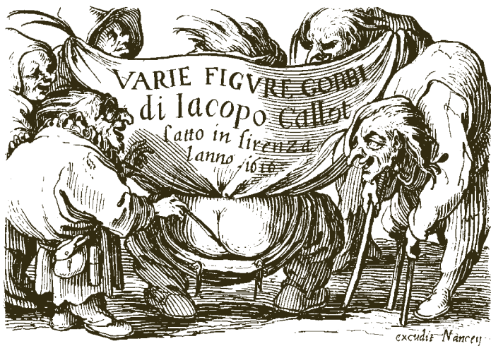
Titelpagina Varie Figuri Gobbi di Jacopo Callot (Lieure 128)