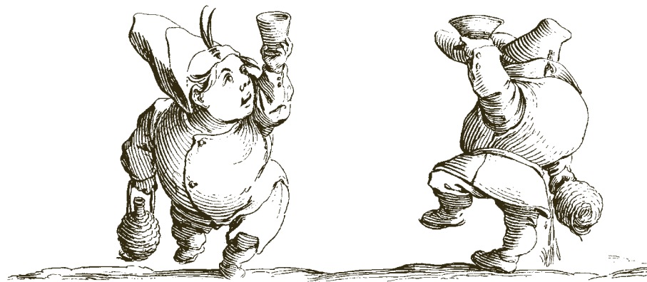
Dwerg met wijnfles en glas, van voren gezien (Lieure 133)