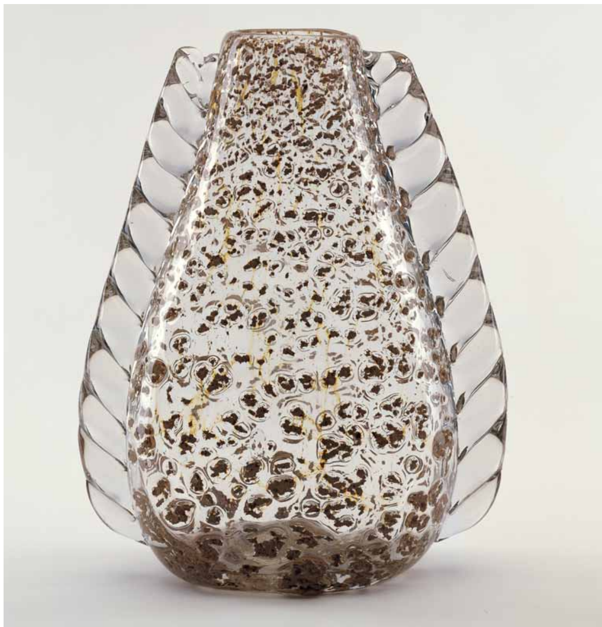
Vaas, Ercole Barovier (Murano 1889-1974 Murano) prod. Ferro Toso Barovier Vetriere Artistiche riunite S.A., Murano 1937. Transparant glas en gekleurd glaspoeder, vrijgeblazen en gevormd, H 37 cm, B 28,5 cm Gemerkt: blindstempel firmanaam onder op de bodem: ars FTB Murano STEDELIJK MUSEUM, AMSTERDAM (AANGEKOCHT IN 1937)

de toen en vogue zijnde Art Déco. Met bijzonder fraaie glasplastieken, eveneens aansluitend bij de internationale Art Déco-stijl, kwam de firma Ferro Toso – S.A.L.I.R. Een tafelstuk van een springende gazelle naar ontwerp van Guido Balsamo Stella (1882-1942) is vermoedelijk na de tentoonstelling in het Stedelijk in particulier Nederlands bezit geraakt en enkele jaren later aan het Stedelijk geschonken. Het tafelstuk is een hoogtepunt van de Italiaanse glaskunst uit de jaren dertig. Is dit bijzondere bezit al weinig bekend, het zelfde geldt voor een grote vaas van lichtblauw glas met deksel waarop twee figuurtjes van gemodelleerd glas de bekroning vormen: Actaeon die door een hond wordt besprongen. Het is een vroeg ontwerp van Flavio Poli (1900-1984) voor de glasblazerij Libero Vitali-Murano – I.V.A.M uit 1930. Dit werk is rechtstreeks aangekocht uit de tentoonstelling van 1931. In 1937 werd een derde voorbeeld van de herlevende Venetiaanse glaskunst aan de jonge collectie kunstnijverheid van het museum toegevoegd: een zware vaas van Ercole Barovier (1889-