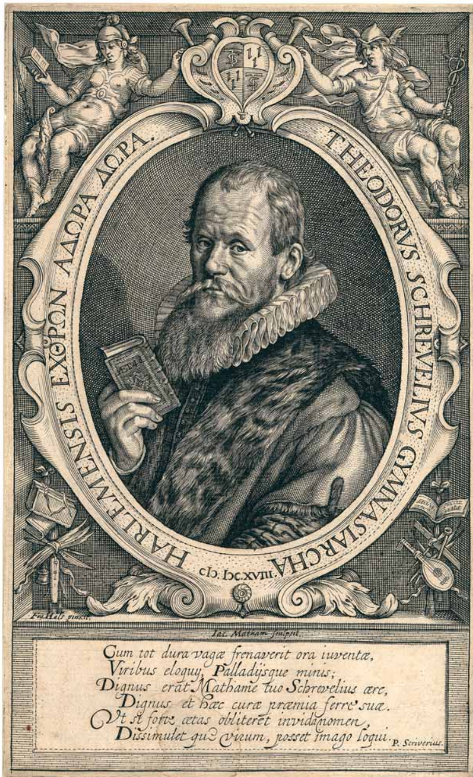
Portret van Theodorus Schrevelius Jacob Matham (1571-1631), naar Frans Hals 1618. Gravure, 26,1 x 15,9 cm

waarvoor ze werden gemaakt – de promotie van het werk van de voorgestelde personen – vereiste een zo levensecht mogelijke weergave van de portretfiguur. Frans Hals was daarvoor de aangewezen specialist en werd daarom waarschijnlijk zo vaak voor dit werk gevraagd. Het portretje van Schrevelius is het vroegst bewaarde voorbeeld van de reeks portretjes. Het is een van de weinige werken van Hals die hij op koper schilderde. Een eerder voorbeeld, het portret van Johannes Bogardus uit 1614, is verloren gegaan en slechts in gravure bekend.