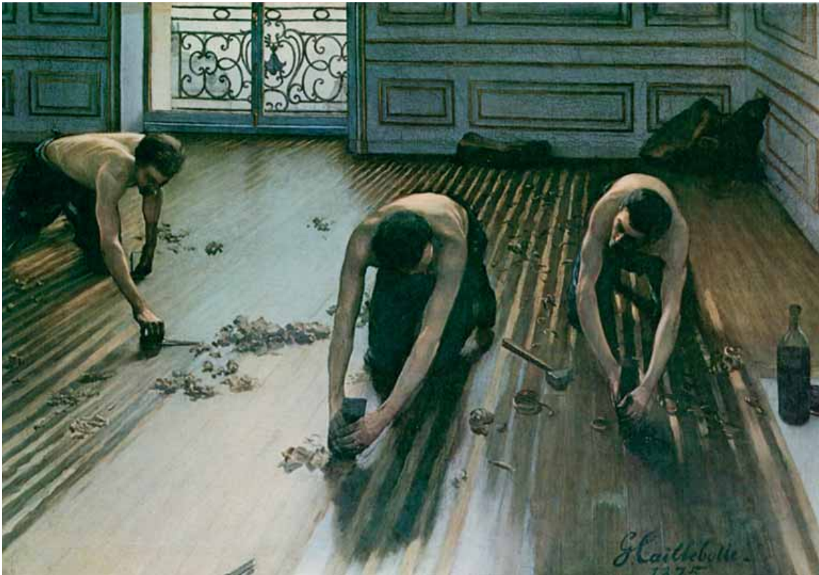
Raboteurs de parquet Gustave Caillebotte 1875. Olieverf op doek, 100 x 44 cm PARIJS, MUSEE D'ORSAY

nieuwe woning die Caillebotte in 1878 had betrokken aan de Boulevard Haussmann. Ook bij andere impressionisten was het uitzicht op de stad vanuit een hooggelegen standpunt een geliefd motief, maar Caillebotte gaf er een sterk persoonlijke invulling aan. De sierlijke gietijzeren balustrade maakt deel uit van veel van zijn composities uit deze reeks. Als motief komt een vergelijkbaar hekwerk echter ook al voor in zijn meest bekende doek, de Raboteurs de parquet uit 1875.