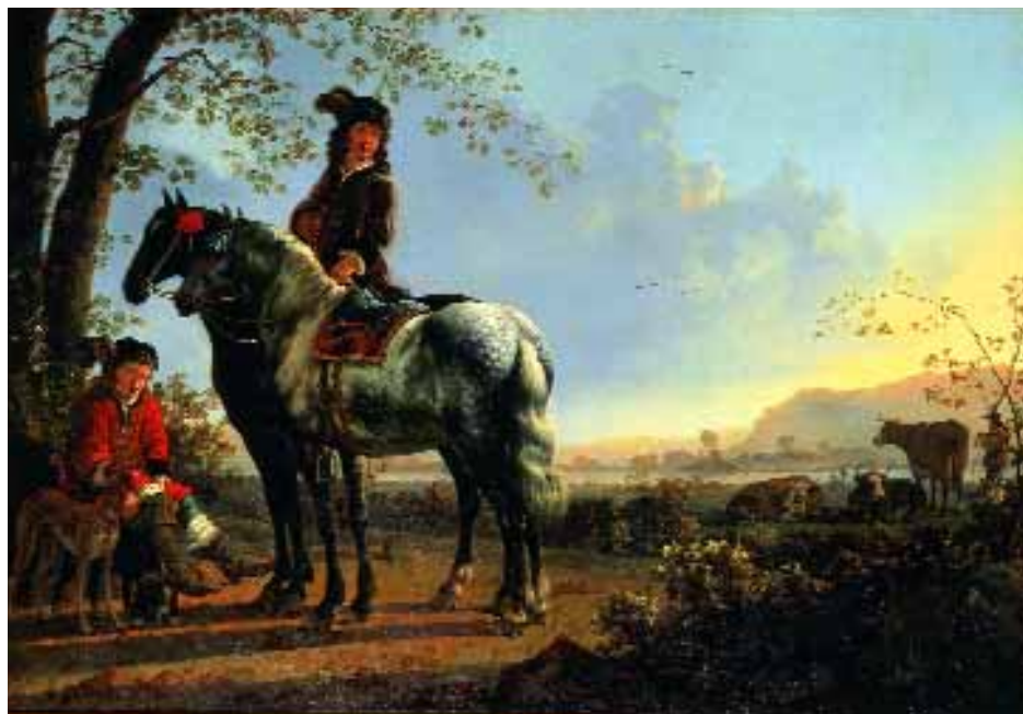
Rustende ruiters in een landschap Aelbert Cuyp (1620-1691) Olieverf op doek, 116 x 168 cm DORDRECHT, DORDRECHTS MUSEUM (aangekocht met steun van de Vereniging Rembrandt)

Jacob Gerritsz. Cuyp (1594-1652). Aelbert Cuyp zal in zijn tijd vooral als dierenschilder een goede reputatie hebben gehad. In het begin van zijn carrière heeft hij meermaals onderwerpen als Orpheus en de dieren en Adam geeft namen aan de dieren ter hand genomen. Al in 1639 liet