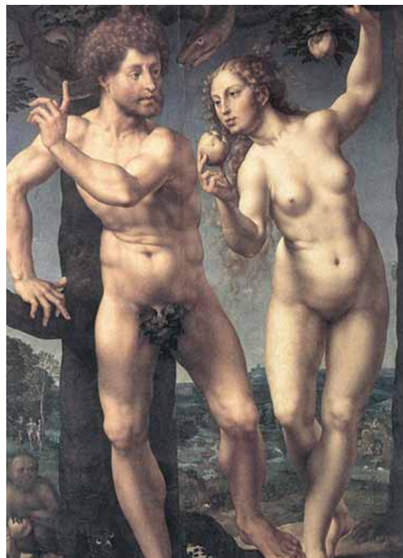
De Zondeval Jan Gossaert 1525. Olieverf op paneel STAATLICHE MUSEEN BERLIN, GEMALDEGALERIE

De Zondeval bevond zich in de vorige eeuw in particulier bezit, totdat het in 1976 werd aangekocht door het Minneapolis Institute of Arts. Dat museum besloot het paneel enkele jaren geleden te verkopen, waarna het