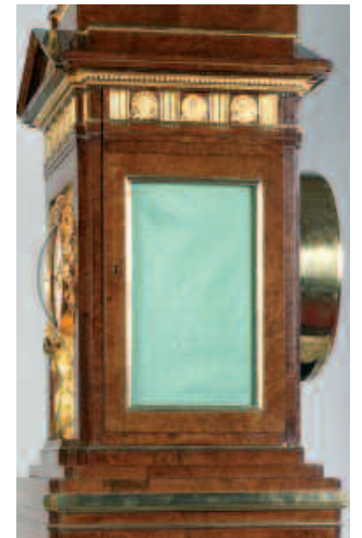
De zijkant van de klok met ter hoogte van het speelwerk een ronde uitbouw aan de achterzijde voor het doorlaten van de klank van orgelpijpjes en snaren.

Bob van Wely Conservator Nationaal Museum van Speelklok tot Pierement