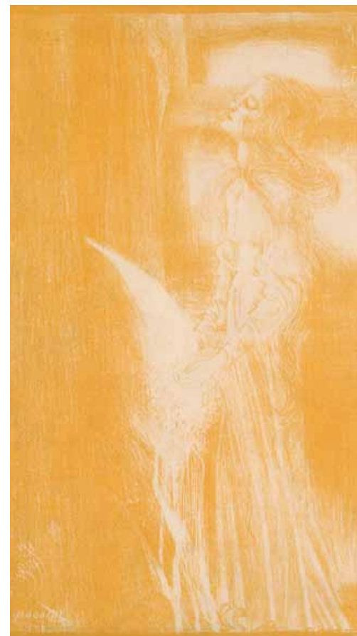
Ontwerp voor de omslag van de catalogus van de Tentoonstelling van Vrouwenarbeid Jan Toorop 1898. Lithografie RIJKSMEUSEM AMSTERDAM

Jenny Reynaerts Conservator negentiende- en twintigste-eeuwse schilderijen Rijksmuseum Amsterdam