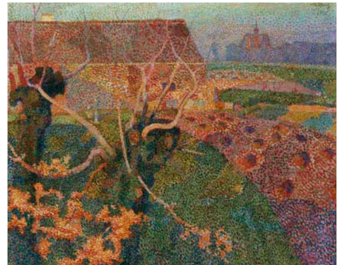
Bloembollenvelden bij Oegstgeest