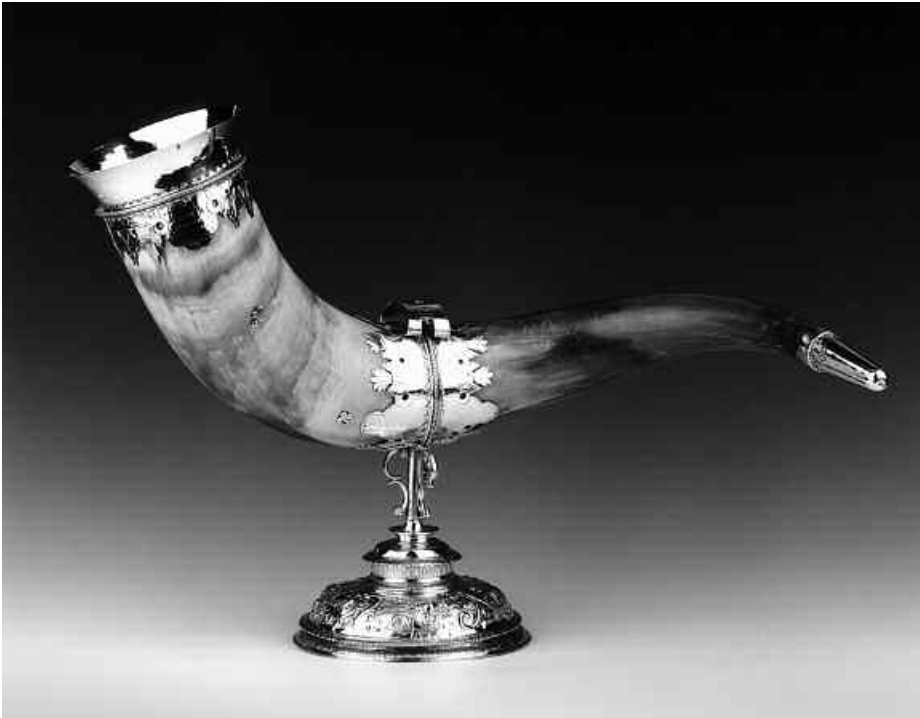
Drinkhoorn van het Amsterdamse Chirurfgijngilde onbekende Meester Ca. 1598. Zilver, buffelhooorn, H 37 cm, L 46 cm AMSTERDAMS HISTORISCH MUSEUM