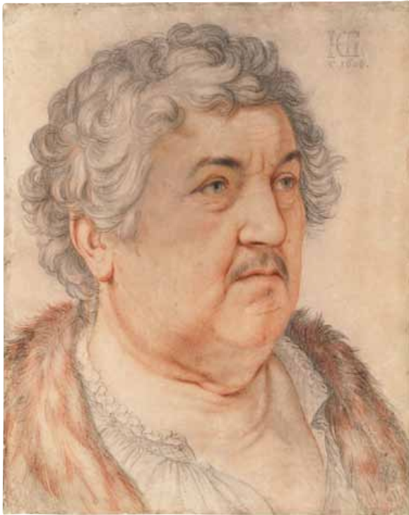
Portret van Jan Govertsen Hendrick Goltzius 1606. Verschillende tinten krijt, gedoezeld, 472 x 376 mm TEYLERS MUSEUM, HAARLEM