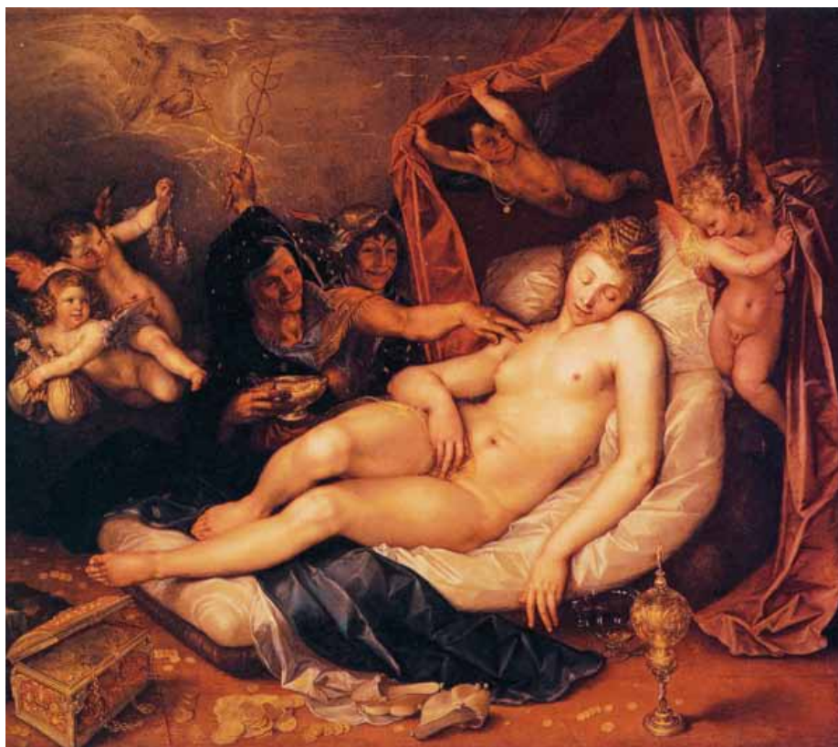
Danaë Hendrick Goltzius 1603. Doek 173,3 x 200 cm LOS ANGELES COUNTY MUSEUM OF ART, LOS ANGELES

(1529-1608), die diverse beeldjes maakte van liggende, slapende vrouwen die door afbeeldingen en kopieën al vroeg grote verspreiding en navolging kregen. Zo bezit het Rijksmuseum een Zuid-Nederlands beeldje van albast uit ongeveer 1560 dat tot dezelfde invloedssfeer behoort.