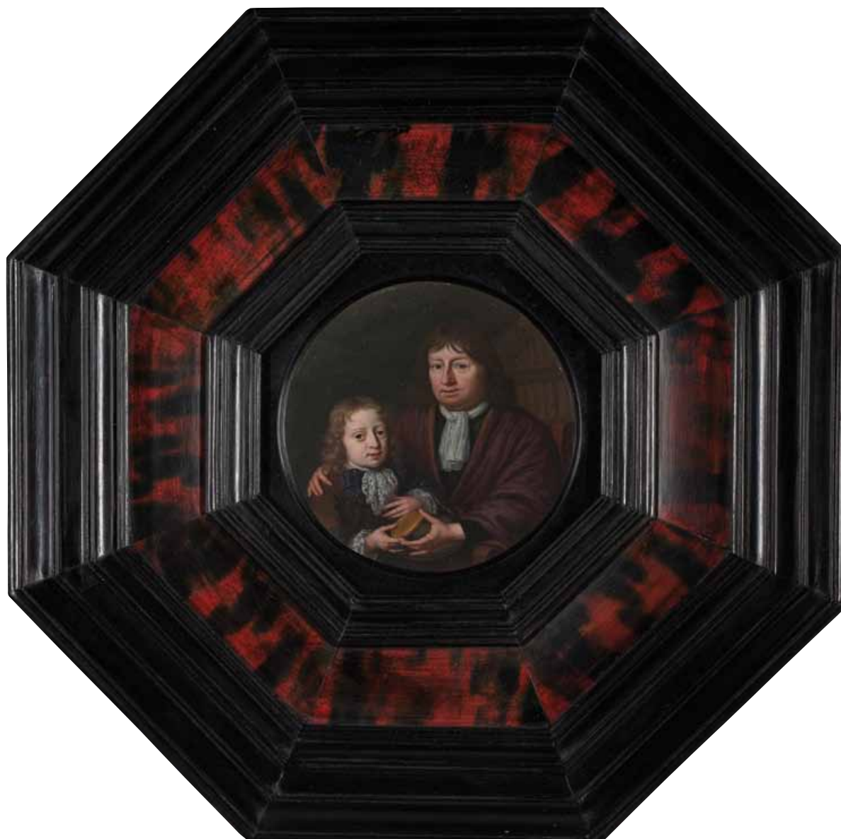
Dubbelportret in zijn originele lijst.