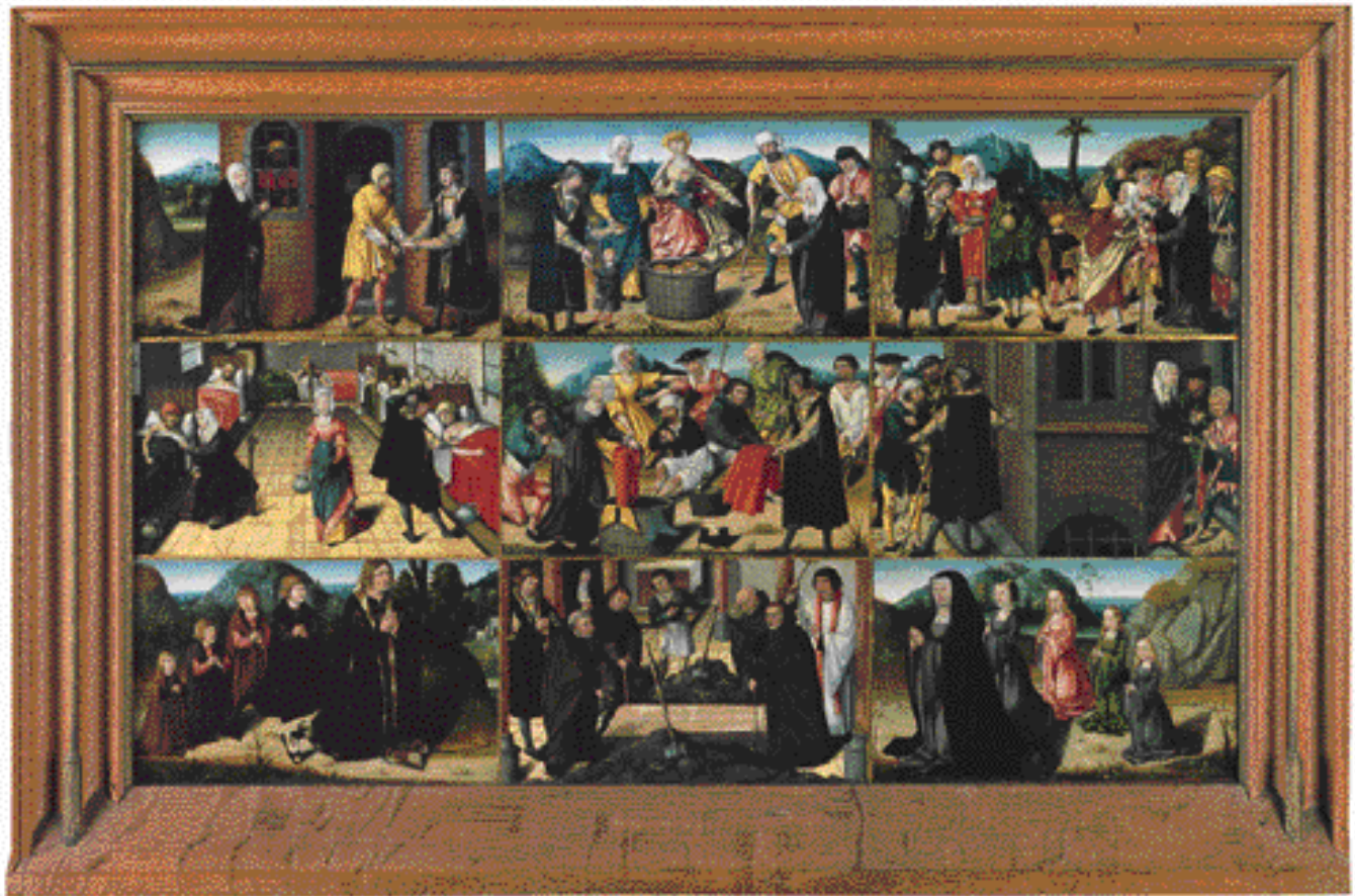
De zeven werken van barmhartigheid met een anonieme familie Meester van de Levensbron Ca. 1510. Olieverf op paneel, 65 x 110 cm RIJKSMUSEUM TWENTHE, ENSCHEDE