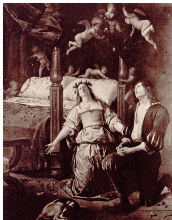
Het gebed (oude toestand, vóór de restauratie van ca. 1960) Jan Steen Olieverf op doek, 82,2 x 68,3 cm