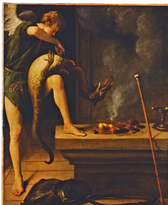
De aartsengel Rafaël knevelt Asmodeus (oude toestand) Jan Steen Olieverf op doek, 66 x 55,5 cm