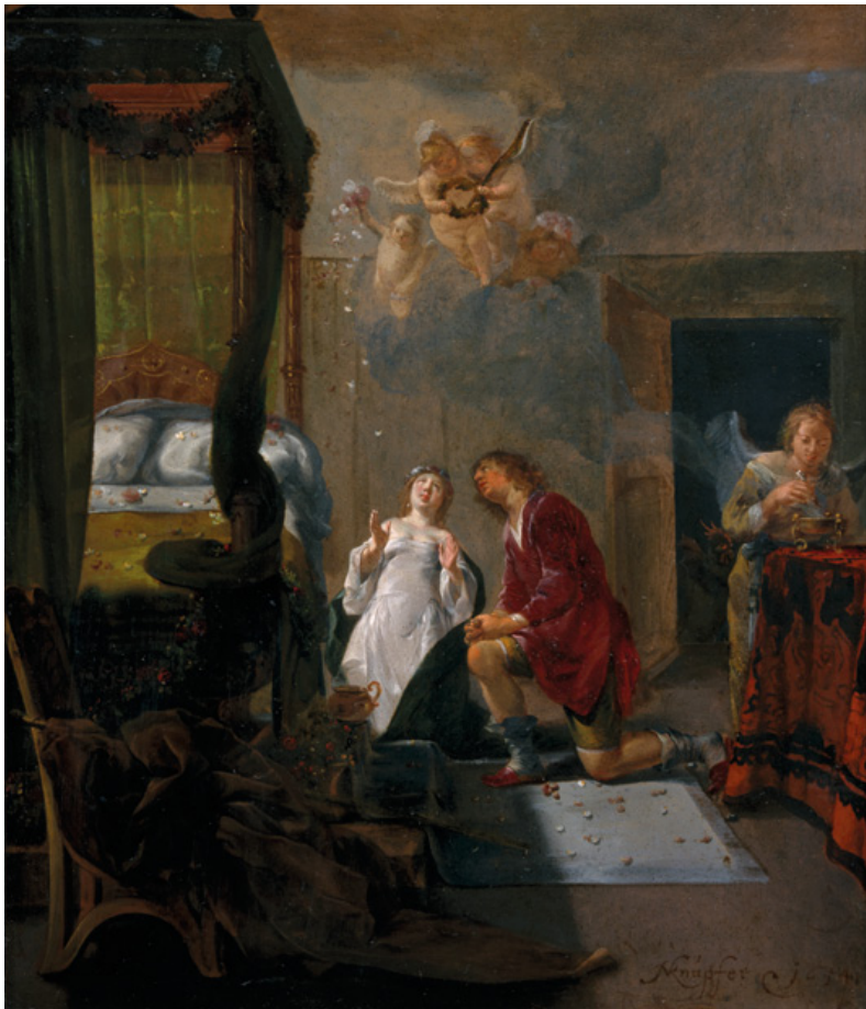
De huwelijksnacht van Tobias en Sara Nicolaes Knüpfer 1654. Olieverf op koper, 29 x 24,5 cm CENTRAAL MUSEUM, UTRECHT

Thiel, directeur schilderijen van het Rijksmuseum, demonstreerden dat de twee stukken inderdaad samen één geheel vormen door foto's aaneen te passen. Weggeschilderde details die rond 1960 bij een restauratie tevoorschijn waren gekomen, maakten dat extra duidelijk. Over het onderwerp kon nu geen twijfel meer bestaan. Wel veronderstelde Van Thiel dat tussen beide schilderijdelen een strook verloren was gegaan.