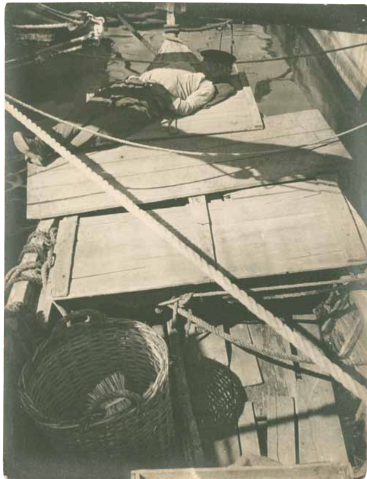
Slapende visser op een boot, Marseille

Enkele jaren geleden kocht het Rijksmuseum – met steun van de BankGiro Loterij, het Paul Huf Fonds en het Huizinga Fonds – een andere foto uit dezelfde reeks van Moholy-Nagy. De foto van een slapende man op een vissersboot is vooral een spel van lijnen en vormen, met