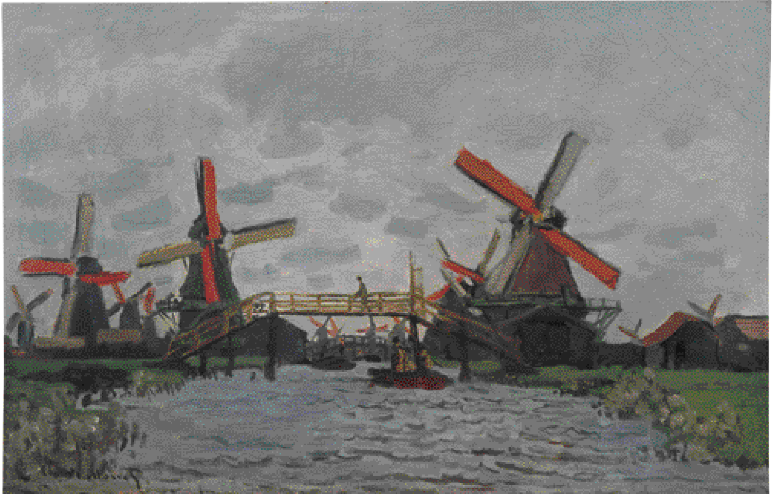
Molens in het Westzijderveld bij Zaandam Claude Monet (1840-1926) 1871. Olieverf op doek, 48,5 x 74,2 cm. VAN GOGH MUSEUM, AMSTERDAM