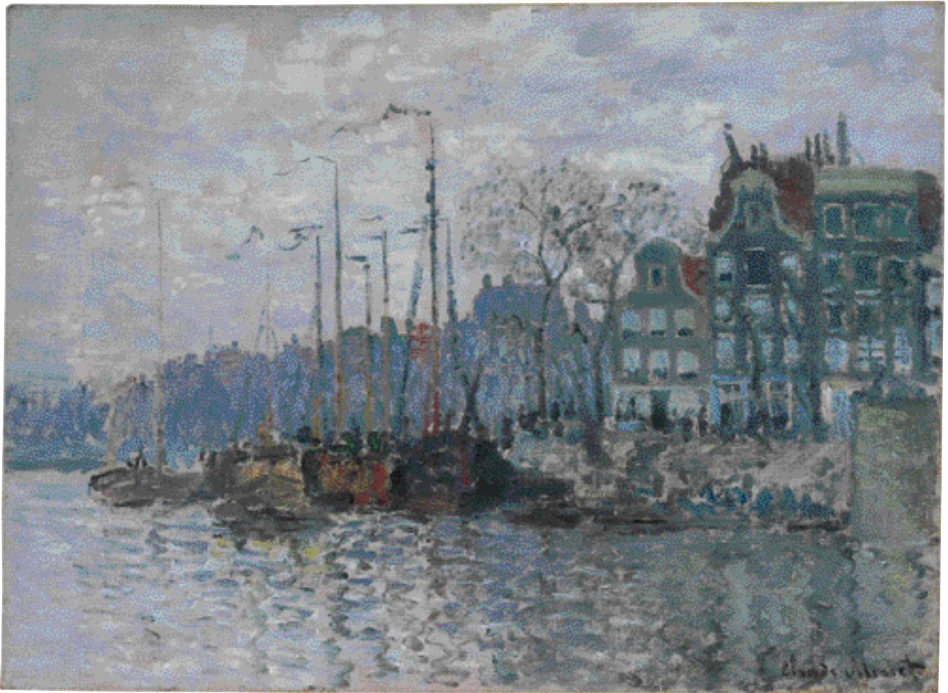
Gezicht op de Prins Hendrikkade en de Kromme Waal in Amsterdam Claude Monet (1840-1926) 1874. Olieverf op doek, 50,2 x 68,5 cm. VAN GOGH MUSEUM, AMSTERDAM