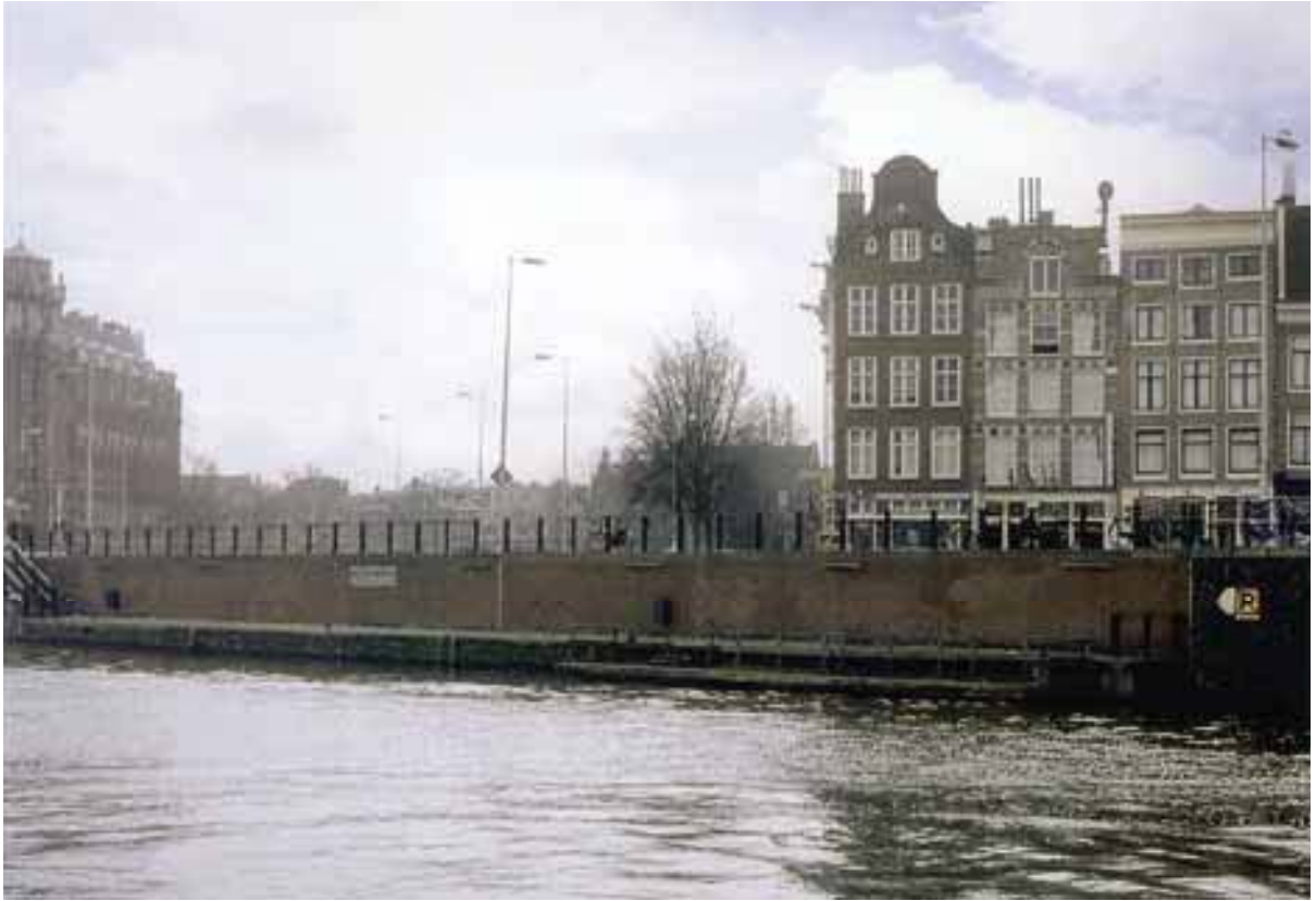
Gezicht op de Prins Hendrikkade 2001.

het is aardig dat Monet zo'n ogenschijnlijk saaie, in feite alledaagse Hollandse dag niet links liet liggen en zich gezinszins verplicht voelde om te wachten op de zondagse stapelwolken waarmee Ruisdael als schilder van het vaderlandse landschap furore had gemaakt. Al dan niet ingegeven door de situatie van het moment verlevendigde hij de onderste luchtpartij met voortvlietende wolken, weergegeven in grote, blokachtige toetsen.