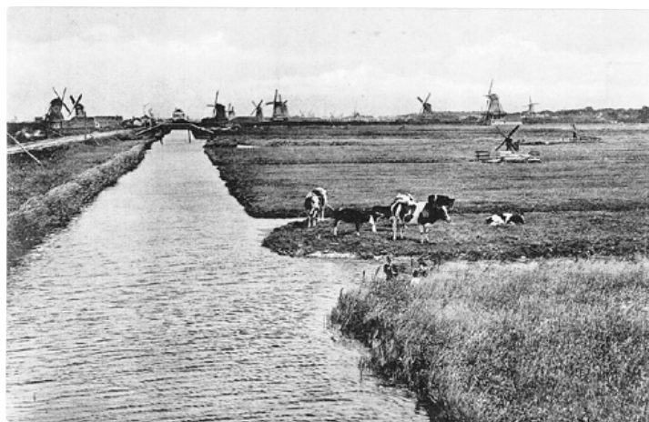
Westzijderveld bij Zaandam Ca. 1900. Prentbriefkaart