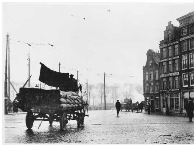
Gezicht op de Prins Hendrikkade Ca. 1910.